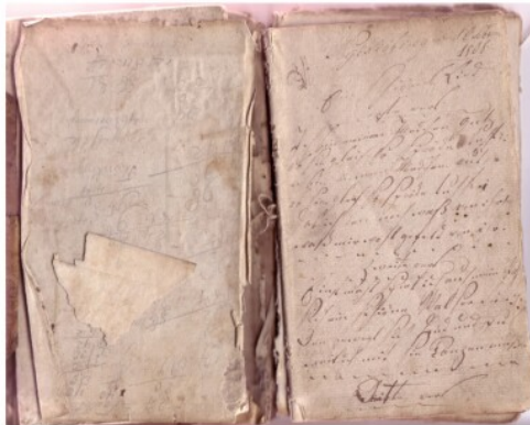
← Fig. 2. Første opslag i en læderindbundet visebog skrevet af Peter Petersen Krog på Falster i 1808 med visen Ich bin meinem Mädchen gut (Jeg er god for min pige).