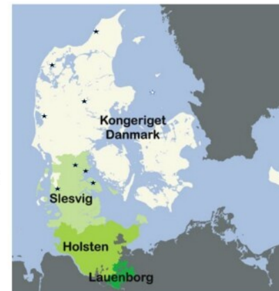
→ Fig. 7. Del af den danske konges riger efter 1815 med soldaternes hjemsted markeret med *.