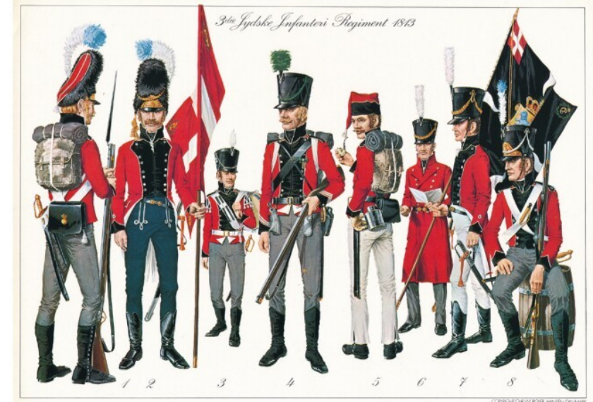
↑ Fig. 1. Uniformer fra 3. Jydske Infanteriregiment i 1813 tegnet af C. Würgler Hansen.

Først efter den endelige fredsslutning endte et korps på 5.000 soldater i Nordfrankrig som en del af de allieredes besættelsestropper fra 1815-1818. De forskellige danske korps betegnedes som auxiliærkorps (hjælpekorps).