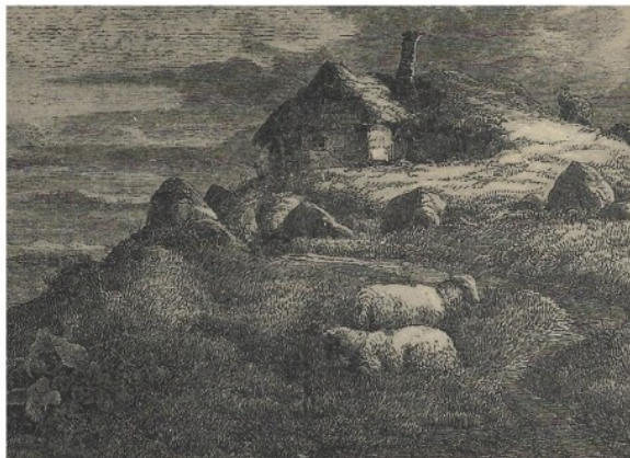
← Fig. 6. Tegning i Illustreret Tidende 1860 som viser veteranen Hans Børglums usle hytte i en gravhøj i Vedsted i Sønderjylland. Tegningen senere brugt som motiv på postkort.