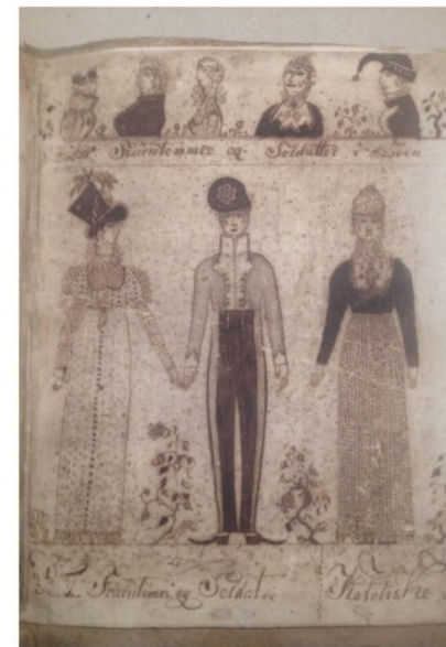
↑ Fig. 5. Tegning fra Christen Jensen Fouerbyes visebog, der viser en dansk soldat mellem en dansk pige (med hat) og en 'katolisk' pige.

Hun Særken over Hoved tager og sprang i Sengen meget fager lagde sig udi min arm indtil vi blev noget varm Paa Amors værk vi da begynte Ja det var det som hun øndte Ja vel femten gang i Rad gjorde jeg mig det nok glad